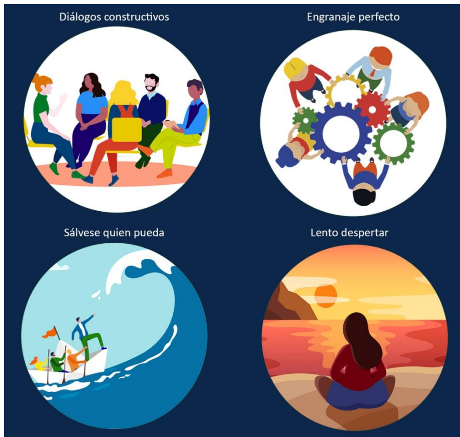
Figura 1: Los cuatro escenarios concebidos en función del comportamiento proactivo o reactivo del gobierno o del sector privado. En este contexto, la proactividad es un indicador de la intención de cada uno de estos agentes en acometer las acciones necesarias para impulsar la creación de ecosistemas digitales promotores del desarrollo socioeconómico, mientras que la reactividad alude a la incapacidad para actuar en esa dirección.

En el Cuadro 12 se presenta una breve descripción de las características principales relacionadas con cada uno de los escenarios propuestos. En su conjunto, tales escenarios son representativos de las situaciones que pueden encontrarse en los diversos países suramericanos y centroamericanos que participan en la ejecución del proyecto BELLA II por parte de RedCLARA.