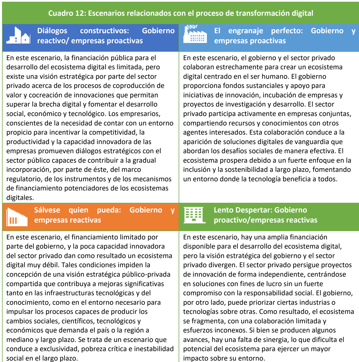
Cuadro 12: Escenarios relacionados con el proceso de transformación digital

El escenario «Engranaje perfecto» representa una situación alejada de la realidad actual de los países de la región. El valor principal de este escenario es que resume las características del estado deseado, apuesta hacia la que deberíamos aproximarnos en el mediano plazo. Los otros tres escenarios se acercan más a las condiciones que, con matices, podemos observar en los países de la región, dependiendo de la madurez y las fortalezas de sus sistemas o ecosistemas nacionales o regionales de innovación. En un país